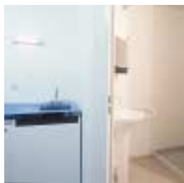
Le cabinet de toilettes / Toilet corner

Le séjour : bureau, bibliothèque avec plan de travail, lit en 200 avec matelas, alèse, chaise, étagère ou chevet-tabouret, volets roulants et voilage au RdC, double-rideaux à l'étage.